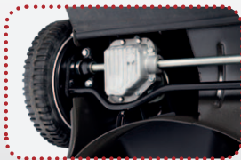
kovová pojezdová převodovka