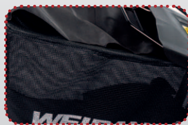
objemný koš s protiprachovou ochranou obsluhy