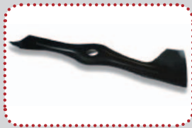
profesionální sběrací nůž