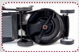
ideálně tvarované šasi sekačky