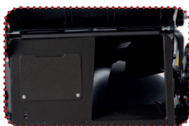
zadní výhoz, servisní dvířka k převodovce