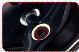
masivní turbo nůž s třecí spojkou „BIG BLADE“